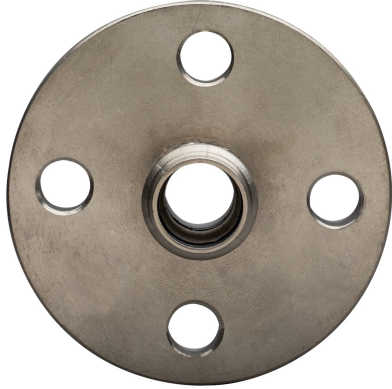
Manicotto femmina flangiato PN10/16.