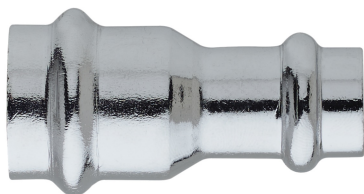
Manicotto di riduzione femmina.