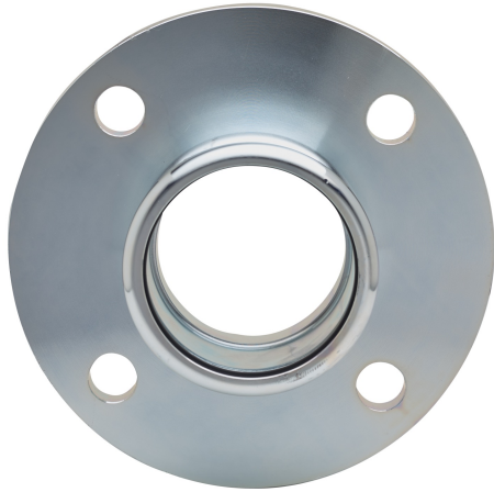
Manicotto flangiato F PN16.