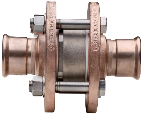
Clapet anti retour à disco PN16.