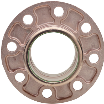
Joint avec bride PN10/16.