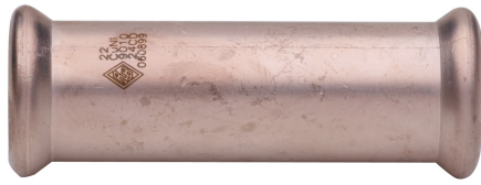
Manguito de paso.