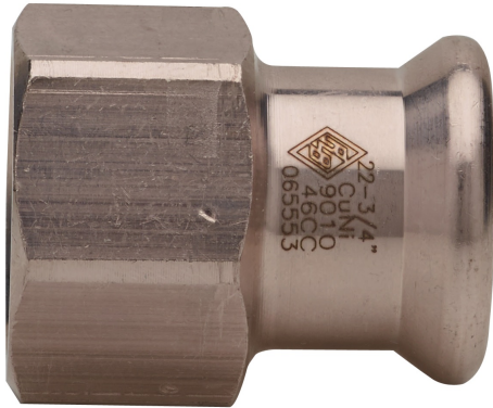
Manguito mixto - roscado hembra.