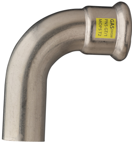
Curva 90° M/H.