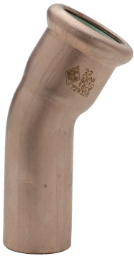
M/F 30° elbow.