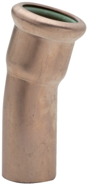
M/F 15° elbow.