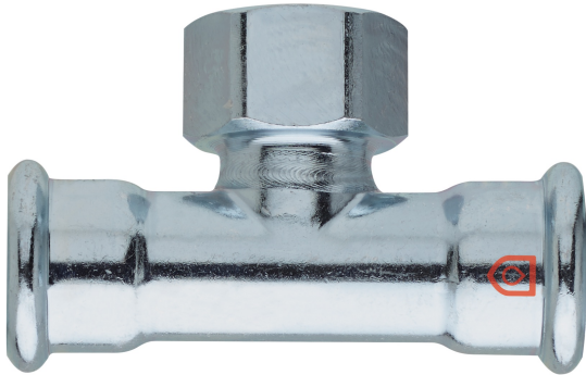
T-Stück I mit I Gewinde.